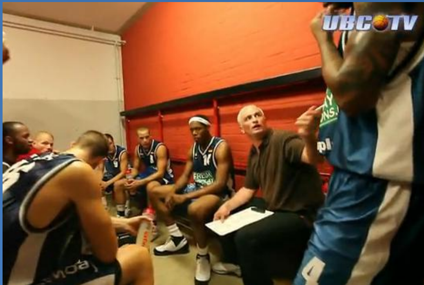
Ausschnitt aus einem UBC-TV-Beitrag