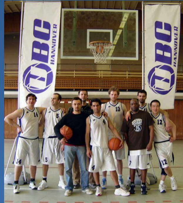
Aufstieg in die Oberliga 2005