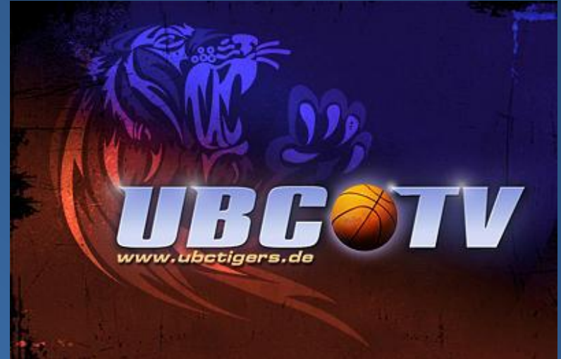
Logo von „UBC-TV“

„UBC-TV“ ist ein unternehmenseigenes Kommunikationsmittel der UBC Tigers und liefert online Videoberichte z.B. über die Saisonvorbereitungen, Zusammenschnitte von Heimspielen sowie diverse Personen und Aktionen aus dem Umfeld der Tigers. Weitere Themen aus der jüngsten Vergangenheit: Dokumentationen über die ehrenamtlichen Helfer; den von UBC-Fans initiierten „Basketball Flashmob“ in Hannover, Musikvideos und vieles mehr.