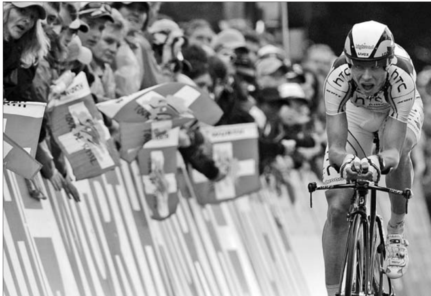
AUF UND DAVON: Tony Martin will sich zum Tour-Auftakt das Gelbe Trikot schnappen.