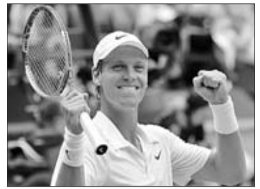
WEITER: Tomas Berdych steht nach dem Sieg gegen Novak Djokovic im Wimbledon-Finale.