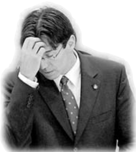
RATLOS: Auch Bundestrainer Uwe Krupp muss sich Kritik gefallen lassen.